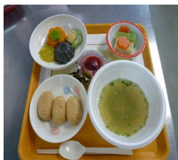
ソフト食バージョン！

方の講習会を何度もひらき練習したので、プロも顔負けの出来映えで皆様に喜ばれました。この他に栄養室では、蟹グラタン・ホタテと野菜のテリーヌ・煮しめ三種盛り・丹波黒豆・栗きんとんを作り、さらに砺波魚商業協同組合の皆様から海鮮鍋と刺身の舟盛りを提供していただき、新年会にはふさわしい大変豪華な食事を楽しんでいただくことができました。